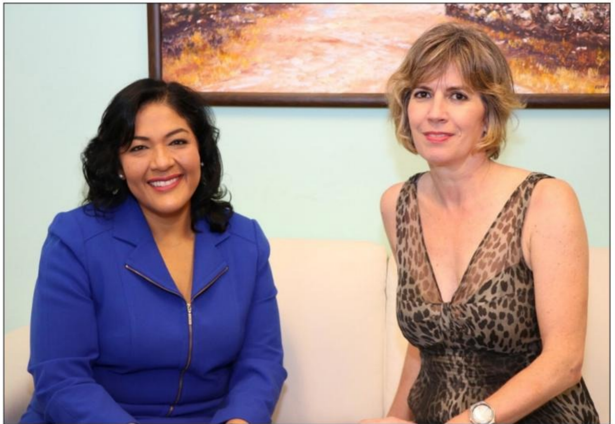
di minister encarga cu finansa, economia y cultura.

E entrevista a concentra riba e experiencia pa ta hende muher den puesto di lideraszgo na un Pais. Tabata un entrevista masha ameno den cual e mandatario a conta di su yegada inespera riba e tarima politico di nos Pais, su crecemento como politico y parlamentario den oposicion y awor den e puesto ehecutivo